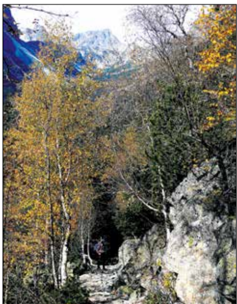
Pod Zamkovského chatou.

Na druhý deň ma čakala oddychovejšia časť trasy, lebo vzdialenosťou i prevýšením nedosahovala parametre predchádzajúceho dňa, navyše som si cestu uľahčil hneď na začiatku, keď som sa lanovkou vyviezol z Tatranskej Lomnice na zastávku Štart. Odtiaľ som po turistickom chodníku s modrou značkou pokračoval stúpaním k Falvarskej poľane, kde sa cesta stočila vľavo a pokračovala okolo Malej Svišťovky až na legendárne Skalnaté pleso. Zatiaľ, čo pohľad do doliny mi ukazoval biele mlieko a krajina bola, akoby pravítkom rozdelená na „vidím a nevidím“, výhľad na Lomnický štít i pleso pred nim nemôže omrzieť nikdy, lebo bol aj tentokrát fenomenálny. Traverzom po úbočí Lomničáku som ďalej mierne zostupoval, znova po typickom tatranskom kamennom chodníku až na Zamkovského chatu, kde som urobil trocha „divadielka“ s mojou knihou a keď sa osadenstvo dosmialo, pokračoval som ďalej tradičným zostupom okolo Rainerovej a Bílkovej