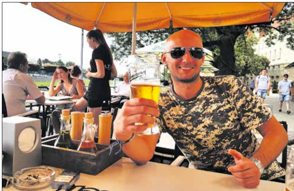
Staropraneň - svieže ochladenie v reštaurácii na promenáde v meste Užhorod.

Na odporúčanie miestnych ľudí (otázka znela: „Kde sa dá dobre vykúpať“) sme sa vydali taxikom na neďaleké niekoľko kilometrov vzdialené jazero Karjera, hlboké viac než 70 metrov a veľmi čisté. Na jazere bola vybudovaná reštaurácia, bar a v upravenej časti jazera sa odohrával turnaj vo vodnom póle. Počas opaľovania a kúpania sme sa rozprávali s miestnymi a tí nám ochotne dali nové odporúčania kde, čo, ako, za koľko atď. Popoludní som zavolať som nášmu taxikárovi, aby po nás prišiel tak ako sme sa dohodli. Nuž, ale ten mal iné plány a neobťažoval sa ani len zdvihnúť telefón. Tak som sa rozhodol, že trochu dobrodružstva nezaškodí a vydali sme sa na cestu po svojich. Po