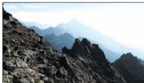
Slavkovský štít z Gerlachu.