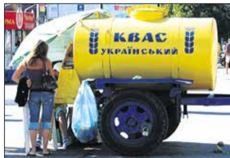
Kvas - predáva sa na ulici v cisterne.

chvíli sa na nás doslova vyrútilo staré žiguly, akoby nás chcelo zraziť. Zastavilo, dvere sa rozleteli do korán a ja som nakukol, čo za Fittipaldi keruje. Šofér bol doslova pod obraz Boží. Červený, opitý Ukrajinec zareval davaj, sadaj, ideme. Pozerám, že ceduľa taxi bola hodená na zadnom sedadle, tak reku aspoň trochu jazdiť vie, napadlo mi. Nuž, nechcelo sa nám chodiť peši, nasadli sme a nastala adrenalínová jazda, pri ktorej som mal neustále ľavú ruku tesne pri volante šoféra, ak by náhodou. Vodič si ako istiaci prvok vybral stredovú čiaru, čo oproti idúcim šoférom spôsobovalo nemalé šoky (tak ako aj nám). Po chvíli sme zastali na benzín-