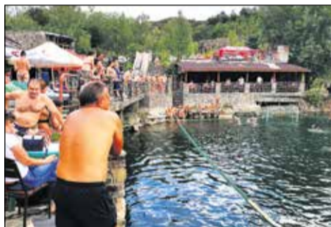
Turnaj vo vodnom póle - Jazero Karjera.

chvíli sa na nás doslova vyrútilo staré žiguly, akoby nás chcelo zraziť. Zastavilo, dvere sa rozleteli do korán a ja som nakukol, čo za Fittipaldi keruje. Šofér bol doslova pod obraz Boží. Červený, opitý Ukrajinec zareval davaj, sadaj, ideme. Pozerám, že ceduľa taxi bola hodená na zadnom sedadle, tak reku aspoň trochu jazdiť vie, napadlo mi. Nuž, nechcelo sa nám chodiť peši, nasadli sme a nastala adrenalínová jazda, pri ktorej som mal neustále ľavú ruku tesne pri volante šoféra, ak by náhodou. Vodič si ako istiaci prvok vybral stredovú čiaru, čo oproti idúcim šoférom spôsobovalo nemalé šoky (tak ako aj nám). Po chvíli sme zastali na benzín-