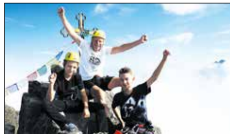
Radosť na vrchole.