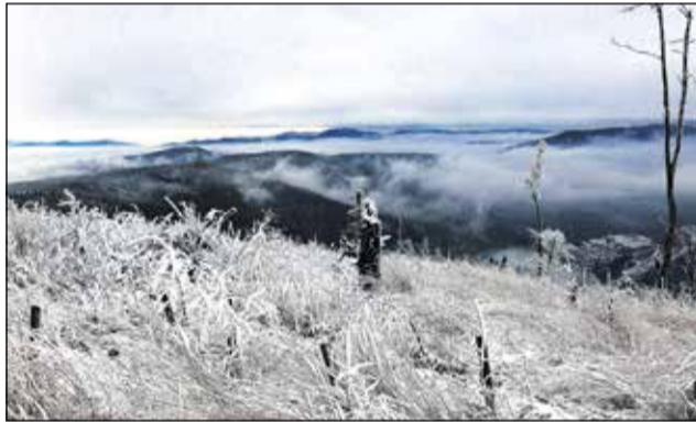
Pod kožu, ale aj do duše zalieza zima na rozľahlých holinách VELKEJ KNOLY

Je mnoho športov, ktoré Vás očaria. Ale najzdravším a najlacnejším je jednoznačne TURISTIKA.