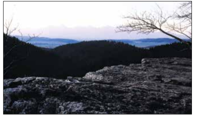
Introvertný i romantický je podvečer na skalnej platni populárneho TOMAŠOVSKÉHO VÝHLADU