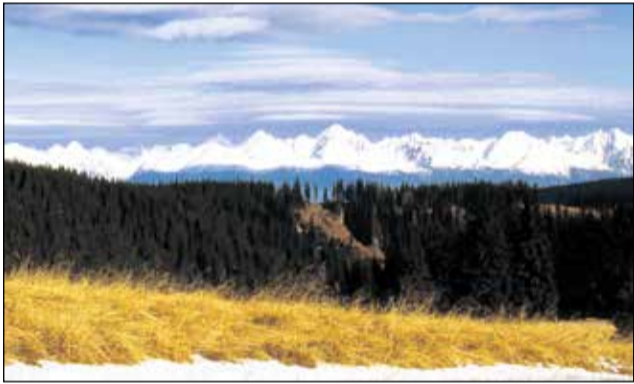
Pre takéto pohľady na Vysoké Tatry treba šliapať ďaleko, až na stráne PREDNEJ HOLE