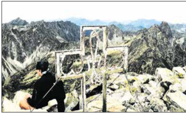
Nekonečné obzory sa ukazujú odvážlivcom z vyše 2.500 metrov vysokej VYSOKEJ