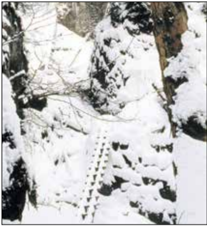
Biele, tiché a tajomné sú výstupy okolo ľadopádov mohutnej SOKOLEJ DOLINY