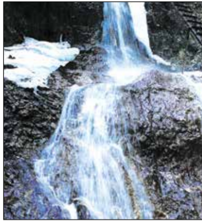
Studené prúdy vody s krajkou ľadových záclon nás vyvedú úžinami rokliny PIECKY