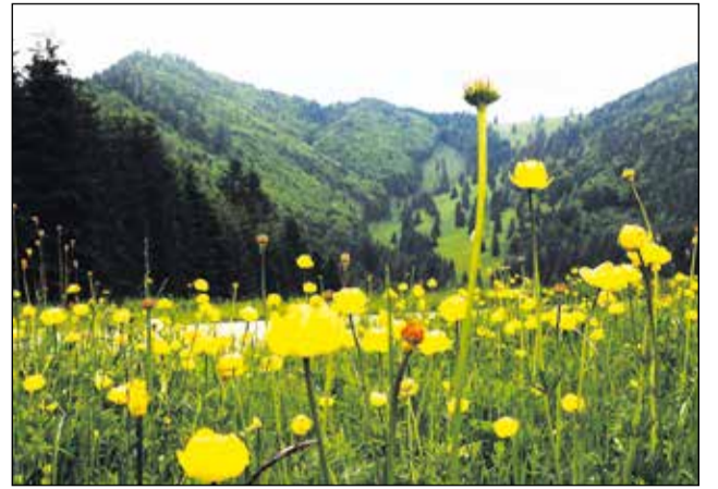
Hore, na nedotknutých lúkach, kvitnú koberec žltohlavov v čarovnom sedle KOPANEC