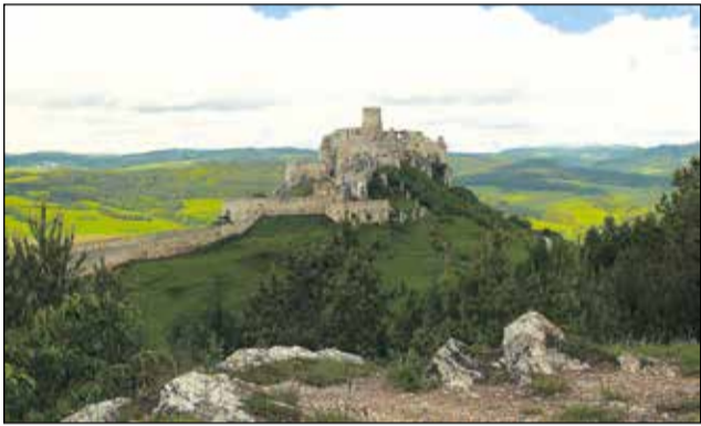
Najkrajšie pohľady z Dreveníka sú na krajinu, ktorej dominuje majestátny SPIŠSKÝ HRAD