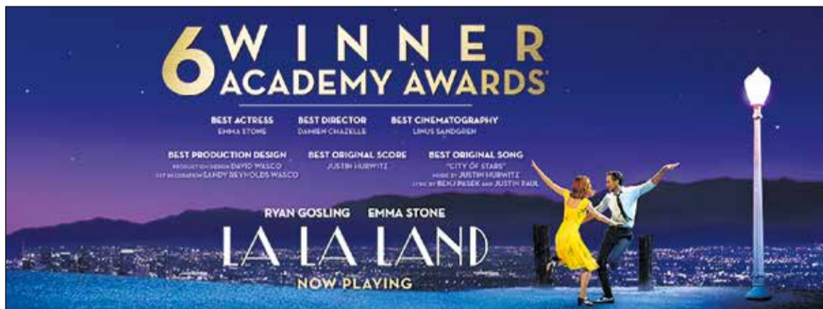
La la Land - Oscar 6 cien.

Holandská kuchyňa v sebe spája prvky nemeckej aj francúzskej gastronómie, ale aj exotickéjšie chuťami a surovinami, ktoré sem zo záhoria, napríklad z Indonézie, dovážali holandskí obchodníci. V Holandsku je najdôležitejším a zároveň aj národným pokrmom syr. Nájdete tu množstvo druhov, ale predovšetkým sú to syry typu gouda alebo eidam. Tieto sa tu vyrábajú aj s rôznymi príchutami, ako napríklad s korením, cesnakom, rascou alebo so žihľavou. Mnohé národné špeciality sa pripravujú z rýb. Typické sú napríklad slede, slanečky, údený úhor, treska, morský jazyk, granáty, alebo mušle. Medzi