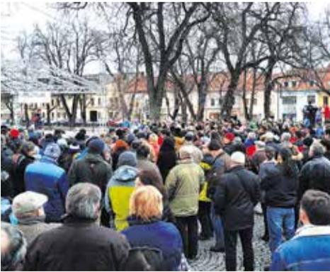
Fotografie poskytol Radim Kopec. Ďakujeme.