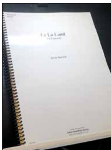
Prvá skúška na turné.