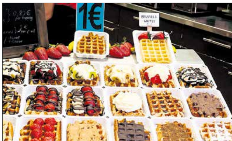
Vafle v Bruseli.