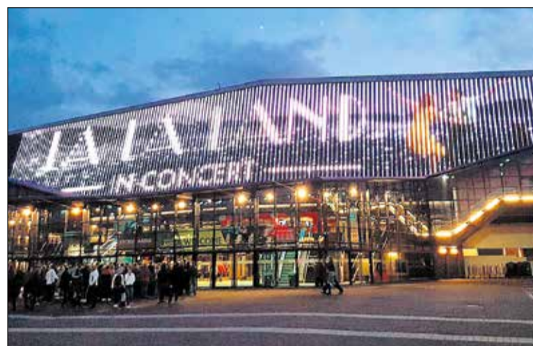
Ahoy Rotterdam pred koncertom.

tradičné pokrmy patria jedlá z jedného hrnca – stamppot (zmes zemiakov, krúpow, strukovín a slaniny), zemiaková kaša, vyprážené korenené mäso alebo zelenina a mäso v cestičku. Netreba zabudnúť ani na špargľu, ktorá sa podáva s klasickou holandskou omáčkou. Zaujímavým zážitkom je sledovať alebo aj vyskúšať holandský zvyk – konzumáciu slanečkov priamo na trhu. Rybu zbavenú hlavy a chrbtov