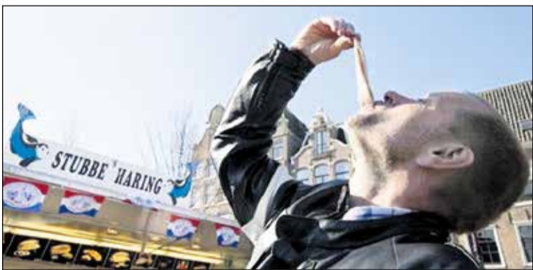
Jedenie rýb Holandsko.